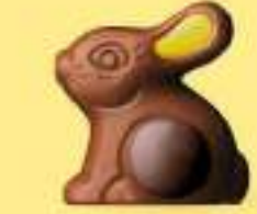
Praliné et riz soufflé