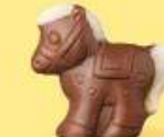
Praliné croustillant aux éclats de crêpe dentelle