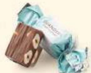
Chocolat au lait