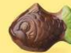
Praliné et noix de coco caramélisée