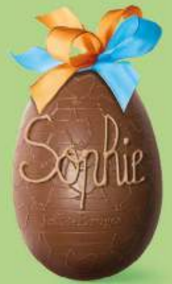
Chocolat au lait

15 CM - 325 G NET Chocolat au lait / noir 26€70* pour 100 g : 8,22 €