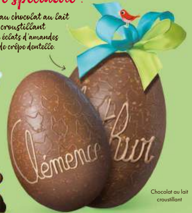
Chocolat au lait croustillant

15 CM - 370 G NET 28€75* pour 100 g : 7,77 €