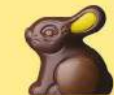
Praliné et éclats d'amandes caramélisées

Un lapin ou une poule, un canard ou un poisson, tout est permis quand on laisse libre cours à la gourmandise !