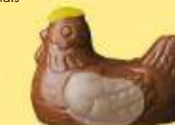
Duo praliné et ganache caramel