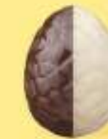
Praliné avec éclats de noisettes