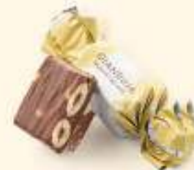
Nougat au miel

POUR VOTRE SANTÉ, PRATIQUEZ UNE ACTIVITÉ PHYSIQUE RÉGULIÈRE. WWW.MANGERBOUGER.FR