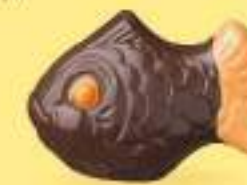
Praliné croustillant aux éclats de crêpe dentelle